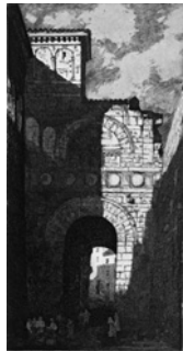
竹腰健造「ペルーシアの アウグストゥス門」

西宮市大谷記念美術館は、「館藏品展」を開催します。織細な線描や色の階調(グラデーション)の美しさが魅力の銅版画を展示します。併催の「西宮市民文化賞受賞作家展」では、昭和63年以降に同賞を芸術・文化分野で受賞した14人の作品を展示します。 2月23日(土)～3月24日(日)の午前10時～午後5時(入館は4時半まで)。水曜休館(20日は開館、21日は休館) ¥300円(高校・大学生200円、小・中学生100円)。3月3日(日)は無料 同館(33・0164)