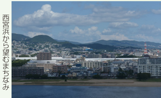
西宮浜から望むまちなみ