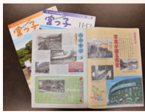
地域ごとに発行されている宮っ子

Q. 地域情報誌「宮っ子」をどの程度読んでいますか。 A. 「時々読んでいます」が39・6%、「よく読んでいます」が35・0%と、74・6%の人が宮っ子を読んでいるという結果が出ています。一方、年代別みると、20歳～29歳の34・3%が「配布されているのは知っているが読んでいない」となっています。また、「配布されているのを知らなかった」が7・1%となっています。