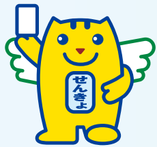
明るい選挙のイメージキャラクター「選挙のめいすいくん」

Q. あなたは投票に行きますか(期日前投票を含む)。 A. 選挙の投票については、「必ず行く」が52・0%と最も多く、次いで「行ったり行かなかったりする」が34・4%となっています。年代別では、年齢が高くなるにつれ投票に行く人は増え、一方で20歳～29歳では「ほとんど行かなかった」「行かない」と答えた人が25・0%に達しています。