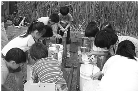
小学校で緊急貯水槽の操作体験をする児童たち

ホースで接続し、確保した水をポンプでくみ上げて行きます。今年度は上ヶ原南・春風・南甲子園小学校で、学校の先生や生徒、自治会の皆さんに緊急貯水槽の操作を体験してもらいました。