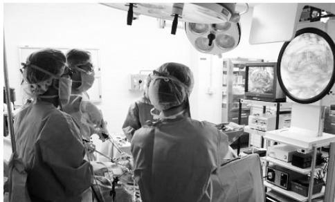
3次元内視鏡を使った手術風景

いました。中央病院の呼吸器センターでは、4月から呼吸器外科専門医を2人体制とし、呼吸器内科と協力して、より専門的で高度な診療を行っています。また、患者の身体的負担が軽減される完全胸腔鏡を使った肺がん根治術を導入し、今ではほとんどの肺がん手術を胸腔鏡で行っています。肺がんは進行が早く、早期診断・治療が重要です。検診は必ず受けましょう。