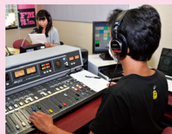
地域の災害情報をお届け

手軽で停電に強いラジオは、災害などの緊急時に、きめ細かな生活情報を得る重要な情報ツールになります。地域のコミュニティ放送局「わくわくFM(78・7メガヘルツ)」は災害時に随時、緊急情報を放送します。防災スピーカーが作動したときには、割り込み放送により同じ内容が放送され、地域の災害情報を得ることが出来ます。