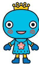
西宮市観光キャラクター・みやたん

平成23年10月から「西宮まちたび博」のキャラクターとしてたくさんの人に西宮の魅力伝え、西宮の観光PRに大きく貢献してきた「みやたん」が、4月から「西宮市観光キャラクター」になりました。これまで以上にさまざまな場所に登場します。お楽しみに！ 問合せは観光振興課(0798・35・3331)へ。