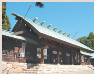
※アクセス…阪急・阪神バス「廣田神社前」バス停下車すぐ

のお告げがあったので、これを受けて祭ったのが始まりとされています。古くは朝廷・貴族の崇敬を受け、社殿の前で貴族の遊びである歌合せがたびたび行われました。中でも承安2年（1172年）に催された歌合せは有名で、当代の貴族58人が集まり1人3句の歌が詠まれました。その自筆本は国宝になっており、郷土資料館ではその複製を収蔵しています。室町時代からは、6月に五穀豊穡を祈願する「お田植え神事」が行われ、長い歴史の中で幾度か中断しましたが、現在も変わらず行われていま