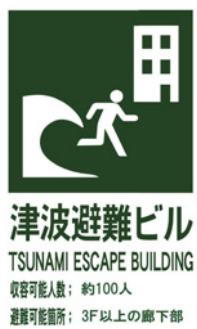
2月11日、地域の皆さんによる津波避難ビル(兵庫医科大学)への避難訓練