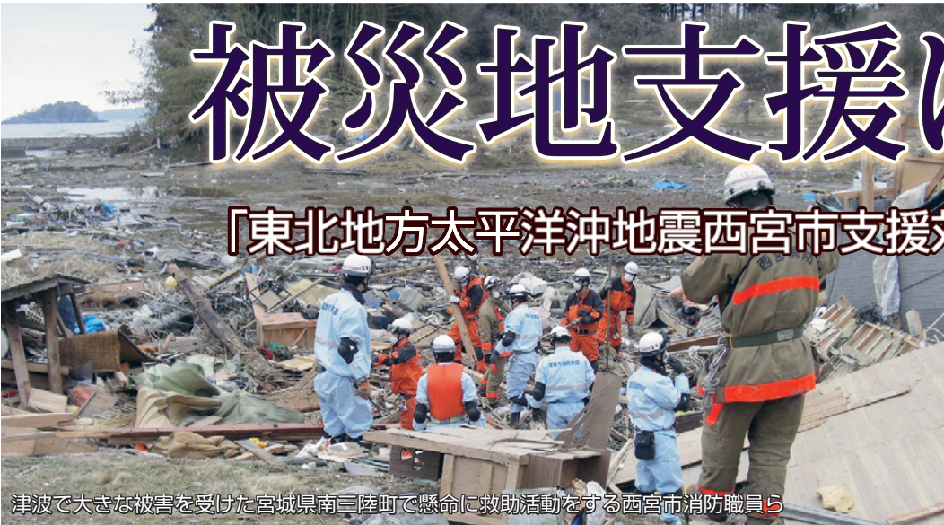
津波で大きな被害を受けた宮城県南三陸町で懸命に救助活動をする西宮市消防職員ら