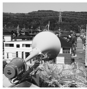
市からの緊急情報を放送

緊急時には、さくらFM(78.7メガヘルツ)やケーブルテレビ「フロンにのみや」で災害情報を放送します。