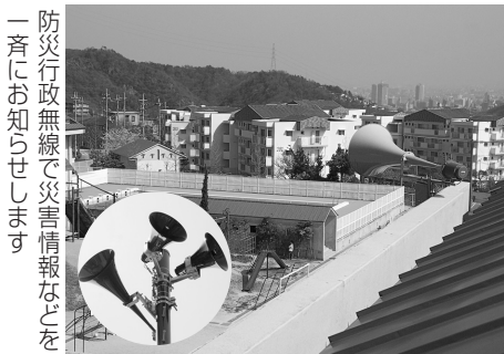
防災行政無線で災害情報などを一斉にお知らせします。

市は、災害などに関する情報を市民の皆さんに迅速かつ確実に伝達することができ、「防災行政無線」に上写真参照の整備を昨年度から4カ年計画で、市内約140カ所の公園や学校などで進めています。