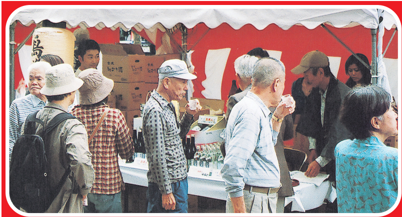
酒どころ西宮の酒と食を堪能しようと多くの人が訪れ、にぎわいます

市、西宮酒造家十日会、西宮商工会議所などは10月3日正午からと4日午前10時から、西宮神社などで「西宮酒ぐらルネサンスと食フェア」を開催します。このイベントは、西宮の伝統産業である日本酒の発信と西宮の「食」を楽しんでもらうものです。13回目。 今回は、パレードや大道芸、人形劇などのほか、日本酒により一層親しんでもらおうと新企画「日本酒塾」を開催します。また、地元産の農作物や、それを使った料理を販売するなど子どもから大人まで楽しめる催しがいっぱいです。入場無料。雨天決行。 問合せは西宮酒ぐらルネサンスと食フェア実行委員会(0798・33・1238:西宮商工会議所内)へ。 ※駐車場はありませんので、車での来場はご遠慮ください。また20歳未満の人の飲酒は禁止されています