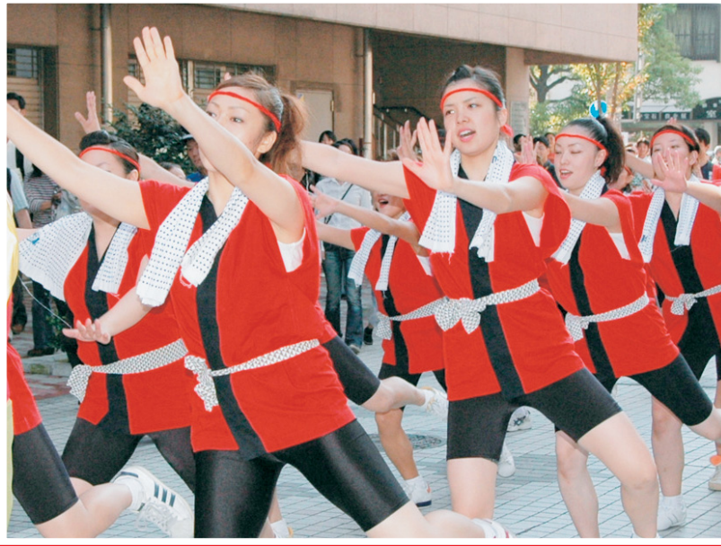
赤い法被姿で西宮中央商店街などを練り歩く「新酒番船パレード」