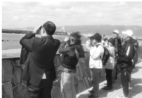
甲子園浜で野鳥の観察をする環境学習サポーターの皆さん