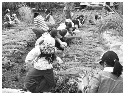
自然とのふれあいをテーマに行われた農業体験

な人が集まり、環境をテーマに地域づくりについて話し合い、地域での活動につなげていくための場です。この場を通じて、地域のさまざまな情報を交換したり、人々の交流の輪を広げていくことも目指しています。