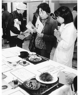
昨年の健康フェアにもたくさんの方が来場しました

【申込】往復ハガキに希望測定名(いずれか一つ)、希望時間帯(午前午後)、住所、氏名、年齢、電話番号を書き、10月3日(必着)までに上ヶ原病院外