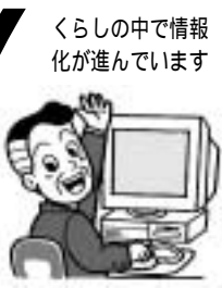
くらしの中で情報化が進んでいます

市は「電子自治体セミナーinnにのみや」を11月18日午後1時からフロンテホールで開催します。 政府は、平成17年に世界最先端のIT国家になることを目指す「e-JAPAN戦略」を発表し、重点計画に沿って行政・公共分野の情報化などに取り組んでいます。また、市は3月に「情報化の基本指針」となる「情報化推進計画」を策定しました。今回セミナー