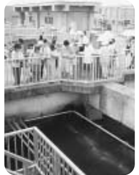
昨年の見学会から

9月10日の午前10時から午後4時まで、武庫川上流浄化センター(078-985-6621)と武庫川下流浄化センター(06-6419-4232)で見学会を開催します。 参加費無料。参加希望者は、9月9日までに希望するセンターに申込を。