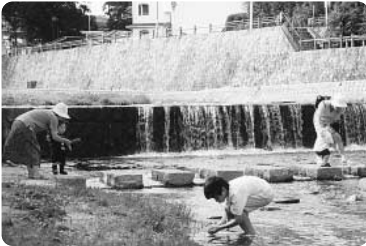
きれいな川の流れをいつまでも

推計人口 45万0369人(女 23万5644人 男 21万4725人) 世帯数 18万5855 面積 100.18km 2 (平成14年8月1日現在)