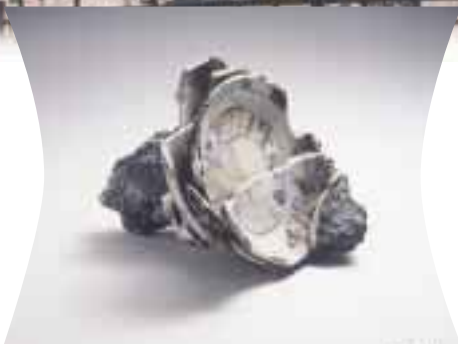
ガラスなどが 付着した小皿 原爆の脅威を伝える 広島原爆ドーム