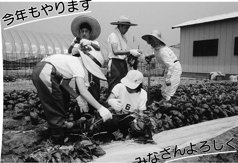
みなさんよろしく