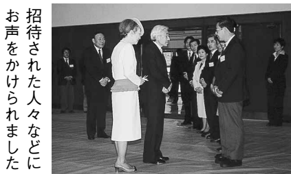
招待された人々などにお声をかけられました

・天皇皇后両陛下は、阪神・淡路大震災の復興状況をご視察のため、4月23日から26日まで兵庫県を訪問されました。