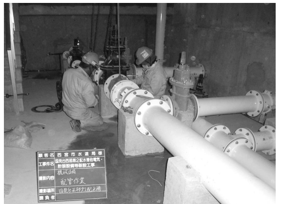
各家庭に水を送る配水管の布設工事(国見台西部第2配水槽で)

水道局では3カ年ごとに財政計画を策定し、経営の見直しを行い、効率的・効果的な事業運営をめざしています。平成18年度は平成16年度からの財政計画の最終年度でした。水道料金などの収入は、財政計画では107億3900万円を見込んでいましたが、実績は101億1000万円にとどまり、6億3800万円の減収となりました。