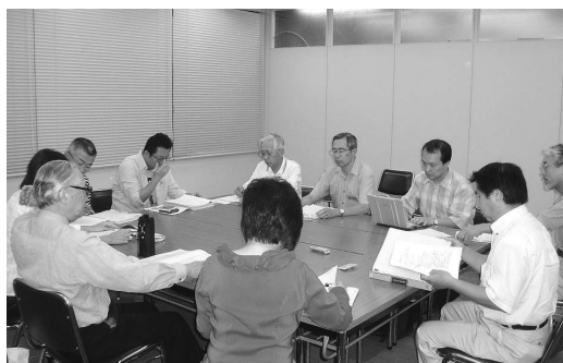
策定委員会で議論が続けられています