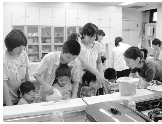
▲学生と子どもたちがホットケーキ作りで交流

主催 特定非営利活動法人 つどい場さくらちゃん 共催 西宮市社会福祉協議会 兵庫県宅老所・グループホーム・グループハウス連絡会