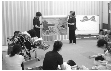
▲障害者の福祉施設での大型紙芝居

「ふれあい交流活動」 高齢者・障害のある方・子どもたちなどと、ふれあい、交流するボランティア活動があります。車いす利用者の外出のお手伝いをしたり、福祉施設の入所者とお話したり、障害のある子どもたちと一緒に遊んだり、幅広く行われています。