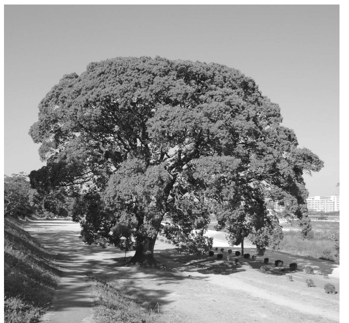
武庫川河川敷緑地のクスノキ

(2) 所有権移転等の制限 落札物件については、契約締結の日から3年間、当公社の承認を得ないで所有権の移転等次することができません。