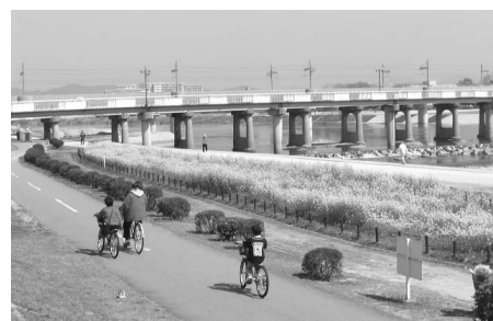
武庫川サイクリングロード