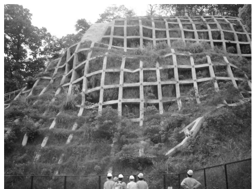
市や県、警察、消防などの防災関係機関は合同で、土砂災害危険予想箇所の防災パトロールを行っています