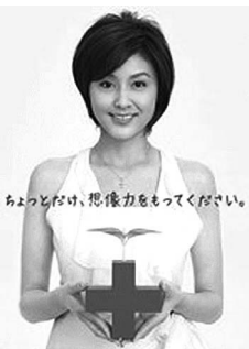
おほんごけい、想像力をもってください。

日本赤十字社は、これらの資金をもとに国際紛争における人道的支援や大規模災害への救援活動などのため、世界186カ国の赤十字社と手を携えて、国の内外で幅広い活動を展開しています。