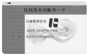
Aタイプ(顔写真なし)

同じパスポート申請や金融機関での口座開設、書留郵便等の受け取りなどの際の公的な身分証明として利用できます。今後、証明書自動交付機による証明書の交付や、印鑑登録・体育施設利用・図書館貸出カードとしての利用など、幅広いサービスの提供を検討していきます。