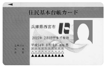
Bタイプ(顔写真付き)