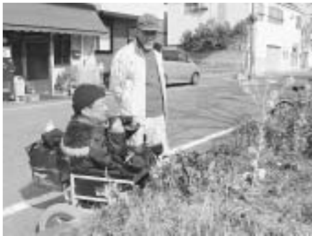
▲車いすの外出支援ボランティア 趣味の写真撮影を一緒に