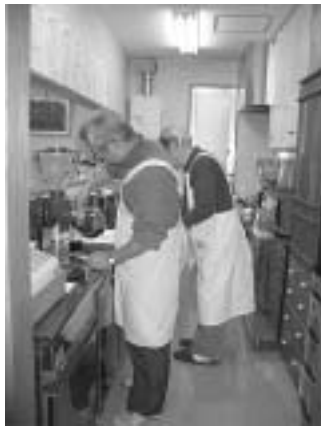
▲作業所での喫茶ボランティア 美味しいコーヒーを入れていきます