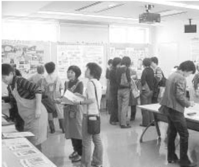
昨年の消費生活展の様子

パネル展 11月11日(土)~12日(日) 講演会&ミニコンサート 13日(月)