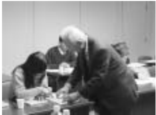
▲「点字の学習」 (福祉学習セミナー)