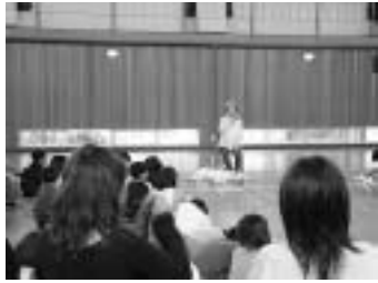
▲盲導犬について子どもと地域住民と一緒に学習中 (福祉学習モデル事業)