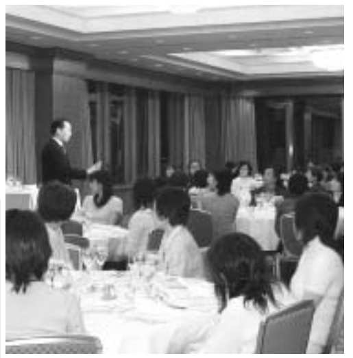
ホテルで行われた「テーブルマナー講座」の様子

同共済は「全国中小企業勤労者福祉サービスセンター(全福ネット)」に加盟していますので、阪神間はもとより、全国3万カ所を超える割引施設が利用できます。また、市独自の旅行補助制度もあります。