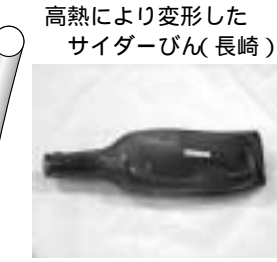
高熱により変形したサイダーびん(長崎) 被爆資料・写真パネル

広島平和記念資料館、長崎原爆資料館から借りた被爆資料約40点と写真パネルなどを展示。