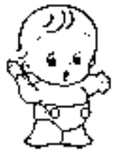
国勢調査のイメージキャラクター「センサスくん」