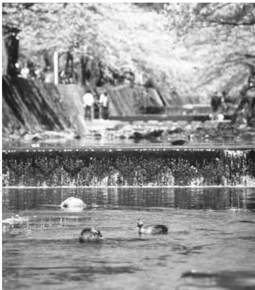
清流が戻った夙川にはカルガモの姿も見られます