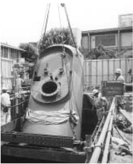
緊急貯水槽設置工事 = 浜脇小学校で

平成15年度末の給水人口は45万5,842人で、前年度より41,411人(0.9%)増えています。また、給水戸数は20万3,998戸で、住宅建設が進んだこともあり、27,633戸(1.4%)増加しました。 しかし、年間総配水量は、574万1,882立方メートルで、給水人口、給水戸数の増加にもかかわらず、前年度より1,30万3,810立方メートル(2.2%)減少しています。