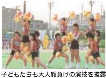
子どもたちも大人顔負けの演技を披露

西宮の夏を彩る祭典、第30回にしのみや市民祭り、中央フェスティバルが、8月28日に開催されます(小雨決行)。今年も、六湛寺公園や市民会館などを会場に、市役所本庁舎周辺で行います。 今年のテーマは、「活力と希望に満ちた にしのみや2004 環(つながり)」です。市民の皆さんが主役のパレードやステージなど、多彩な催しが祭りを盛り上げます。いずれも入場無料。 問合せは、にしのみや市民祭り協議会(0798-353458)市民活動支援課内へ。