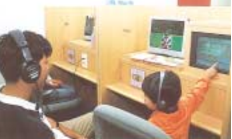
AVコーナーでビデオを楽しむ親子

「AVコーナー」では、音楽映画・一般教養などに関するビデオやDVDを鑑賞できます。↓写真CDの貸出も行っています。