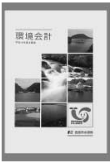
環境会計のパンフレット

水道局は、事業活動の中で環境保全のためにどれだけの費用を使ったか、また、環境保全対策を行うことによってどれだけ環境への負荷を抑えることができたかなどを明らかにして行くための手法である環境会計を作成しました。 西宮市では平成15年12月に「環境学習都市宣言」を行いました。水道局として