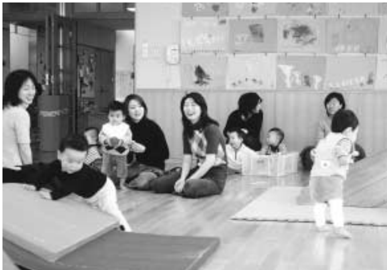
絵本の読み聞かせや紙芝居のタイムです。毎月第4木曜日午後2時30分～午後3時 これらの事業に加え、幼児教育や子育て支援などの調査研究、幼稚園や保育所などの職員の研修、付属あおぞら幼稚園等との連携及びみやっこキッズパークの管理運営などの業務を行っています。

リズムタイム(日曜日を除く) 一緒に遊ぼうよ! 遊びを通じて親子一緒に交流を広げます。毎月第2木曜日午後2時30分～午後3時 誕生日のお楽しみ 誕生日を迎えた子どもたちと一緒に成長をお祝いすると共に、「母親になった日」「父親になった日」のことを想い、喜びを分かち合います。毎月第3木曜日午後2時30分～午後3時 絵本とのであい……うふ・うふうふ