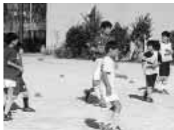
スポーツクラブ21など各地域でのスポーツ振興も進んでいます

スポーツ振興課は、本市のスポーツ振興、生涯スポーツ社会の実現のための施策の現状とあり方について意見をおよび提言を求めるとを目的として、スポーツ振興審議会を設置しています。現委員の任期が3月31日までであることから、次期委員を選任するにあたり、市民の意見や提言を生かす目的で、そのうちの人について一般公募します。