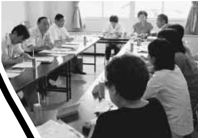
市長と対話 8月28日山口公民館で

市は、10・11月に実施する「まちかどトークにのり」の参加グループを募集します。時間はいずれも午前10時から。対話時間は1グループ30分程度。 今年度は参加者を公募で募り、対象を広げています。7月には鳴尾支所、8月には山口公民館で、6グループ、23人の皆さんが、地域