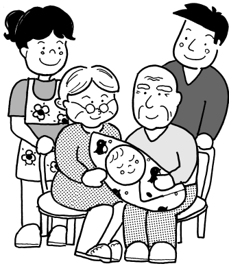
みんなの将来を支える年金制度