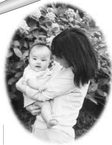
様々な子育て支援制度があります

健全な成長を願う児童手当・児童扶養手当など。子どもは健全な成長を願って児童手当などを支給しています。所得制限などがあります。