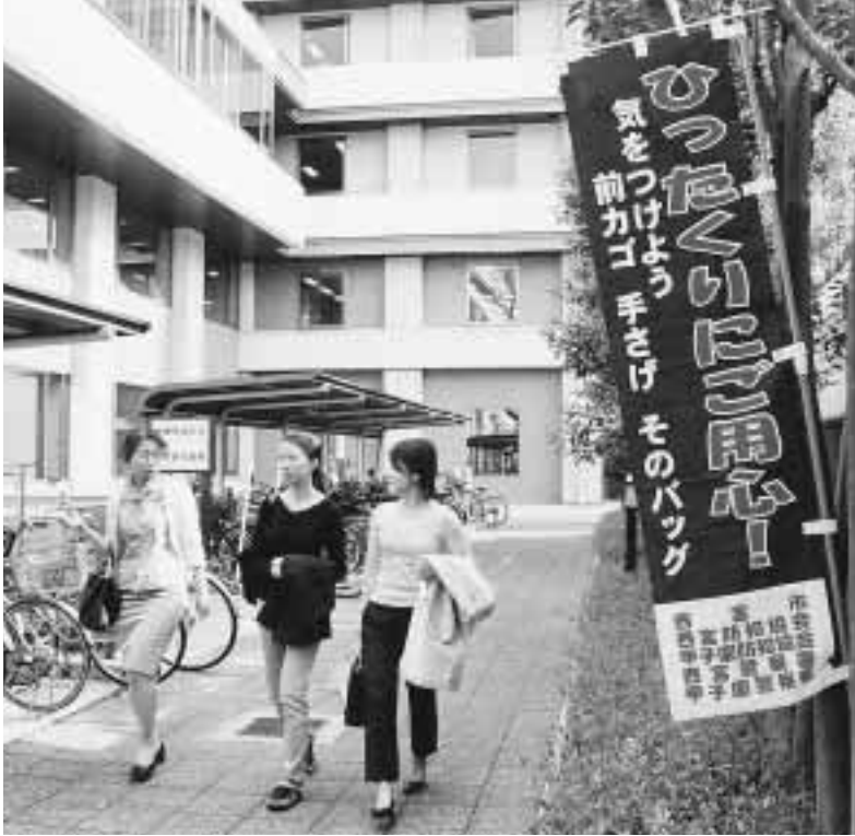
あまりおしゃべりに夢中になると...「ひったくり」防止は、一人ひとりの自衛する心構えが大切です

発行 / 西宮市役所 〒662-8567 西宮市六湛寺町10番3号 TEL / 0798-35-3151 (代表) ホームページ / http://www.nishi.or.jp/ 編集 / 総合企画局市長室広報課 TEL / 0798-35-3400