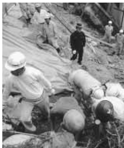
市などが実施する「危険宅地パトロール」

市は、災害の程度によって、避難勧告を発令します。勧告が出た場合、ただちに最寄りの避難所に避難してください。避難は徒歩が原則です。また、わが家の避難所はどこか、あらかじめ確認しておいてください。 土のう袋の無料配布 大雨による家屋への浸水を防ぐため、土のう袋(袋のみ)を無料配布します。