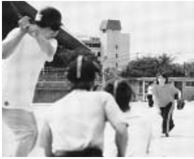
楽しい催し、盛りだくさん