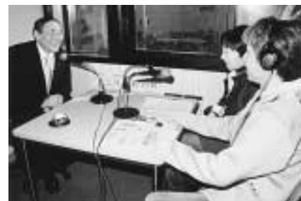
第1火曜日には山田市長も出演