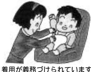
着用が義務づけられています

甲子園交通安全協会は、おむね生後4カ月から4歳くらいまでの間に使用するチャイルドシートの無償貸出しを行います(返却時にクリーニング代10000円が必要です)。