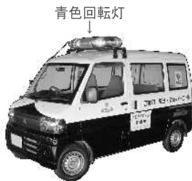
安全・安心パトロールカー（青パト車）

問30 パトロール回数についてどのように思いますか。（あてはまるものをすべて選んで○）