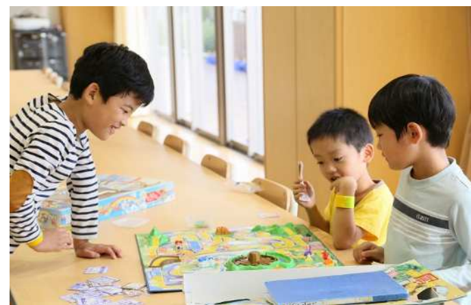
放課後キッズルームの様子