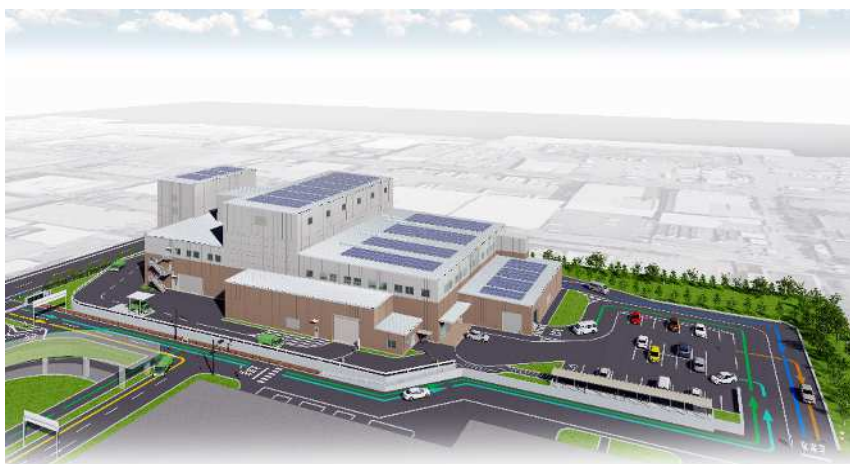
東部総合処理センター破砕選別施設イメージ