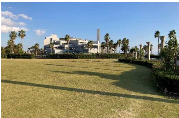
鳴尾浜臨海公園南地区

・鳴尾浜臨海公園南地区再整備事業事業者選定支援業務 / 15,312千円 / R7