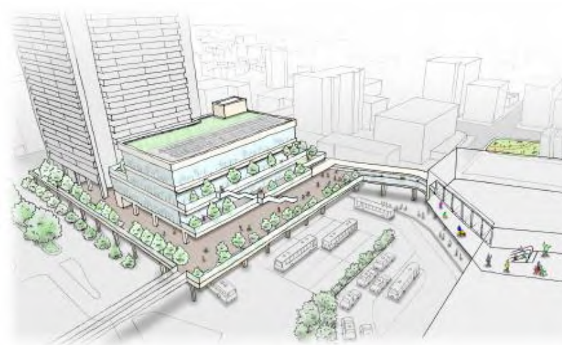
阪神西宮駅北側地区再開発イメージパース