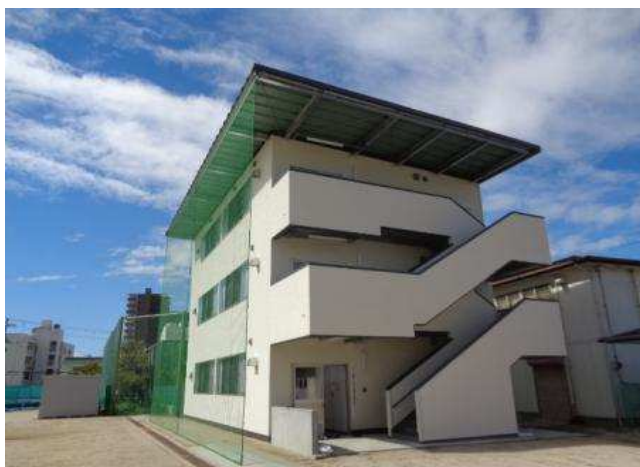
改築後の上甲子園留守家庭児童育成センター

・留守家庭児童対策施設整備事業（甲陽園留守家庭児童育成センター） / 13,995千円 / R7