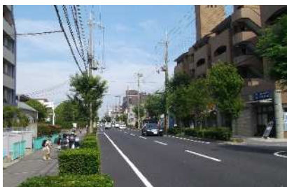
整備前の山手幹線

・令和6年度：山手幹線（熊野工区）・鳴尾今津線・門戸仁川線・小曽根線・今津西線・山口南幹線・札幌筋線の道路改良工事等