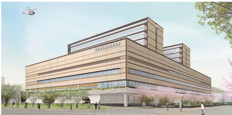
統合新病院完成イメージ