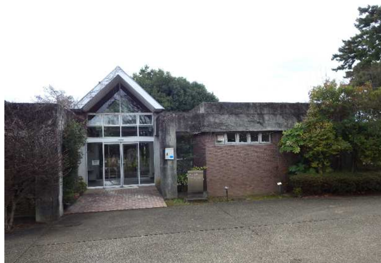
既設の西田公園管理センター外観