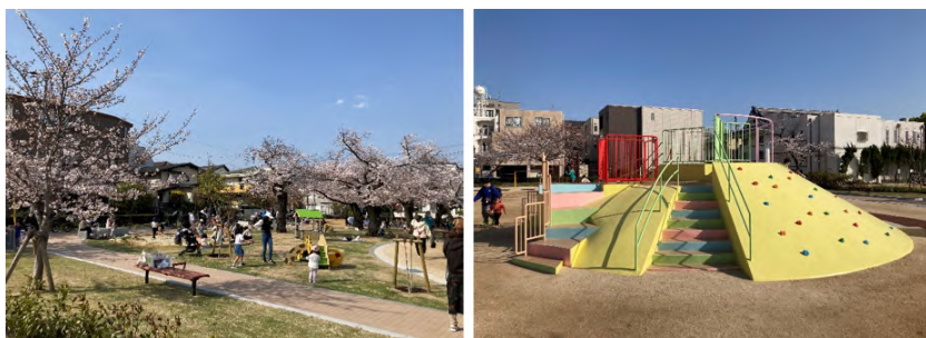
再整備後の八ツ松公園