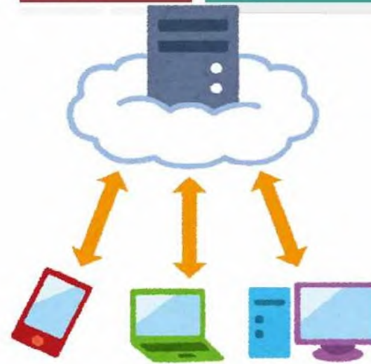
クラウドシステム