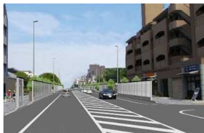
整備後の山手幹線（イメージ）