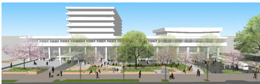
リニューアル後のイメージ