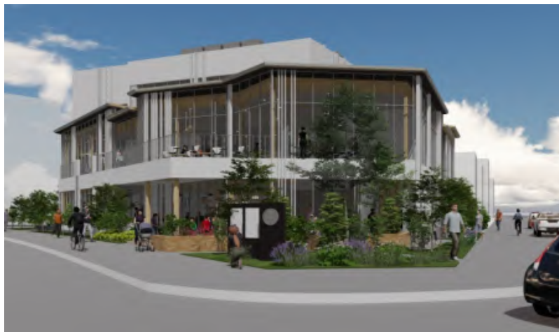
(仮称)越木岩センター完成イメージ