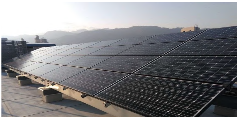
太陽光パネル設置例

令和3年2月に本市が表明した「2050年ゼロ・カーボンシティ」等を実現するためには、行政、市民、事業者が積極的に課題解決に向けて取り組んでいくことが必要となる。目標を達成するため、地域脱炭素移行・再エネ推進交付金を活用し、PPAによる再生可能エネルギーの公共施設への導入、車載型蓄電池の導入、個人住宅屋根置太陽光発電への補助など二酸化炭素排出量削減に資する事業を進め、ゼロカーボンシティの実現を図る。