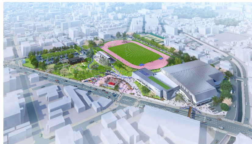
西宮中央運動公園の再整備イメージ

・西宮中央運動公園再整備事業設計・建設モニタリング等支援業務 / 48,510千円 / R7-R8