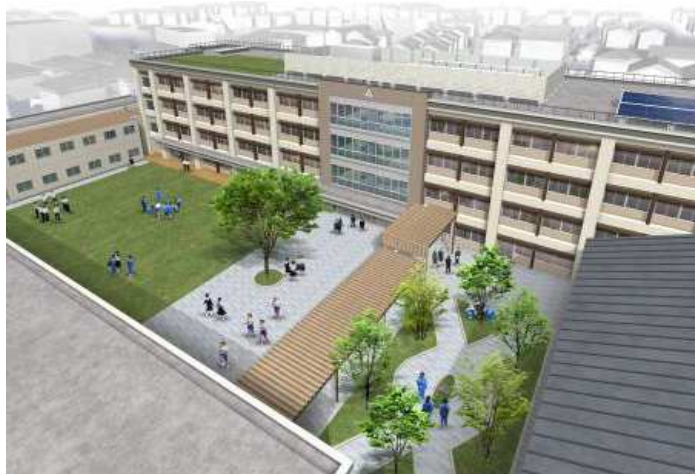
瓦木中学校改築イメージ

・瓦木中学校教育環境整備事業（校舎改築工事増額分） / 81,000千円 / R7