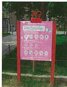
情報よりサインが目立つ