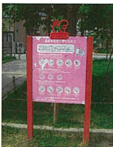
情報よりサインが目立つ