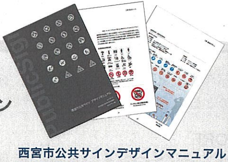
西宮市公共サインデザインマニュアル

そこで、仮設の看板類を設置しないこととし、街の美観や安全に配慮した効果的な公共サインの設置ルールを策定しました！