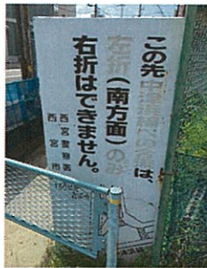
赤色が退色し読み取れない