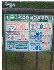
情報量が多く絵柄が過剰