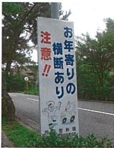
看板が死角をつくり危険