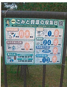
情報量が多く絵柄が過剰