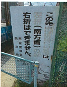
赤色が退色し読み取れない