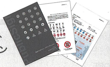
西宮市公共サインデザインマニュアル

そこで、仮設の看板類を設置しないこととし、街の美観や安全に配慮した効果的な公共サインの設置ルールを策定しました！