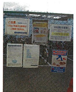
無秩序なサイン配置

そこで、仮設の看板類を設置しないこととし、街の美観や安全に配慮した効果的な公共サインの設置ルールを策定しました！