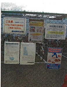
無秩序なサイン配置

そこで、仮設の看板類を設置しないこととし、街の美観や安全に配慮した効果的な公共サインの設置ルールを策定しました！