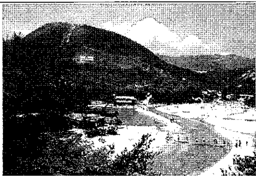
写真① (写真展：山のレジャー・写真集 72 頁)