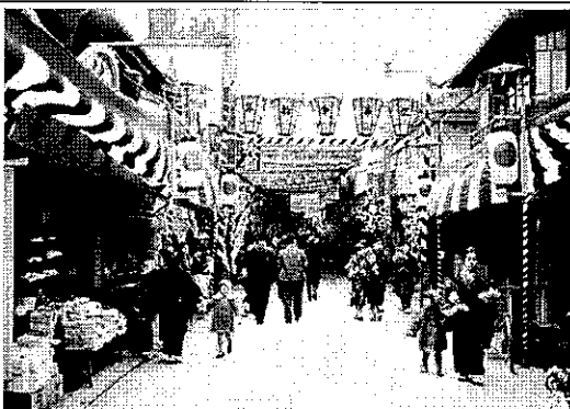
写真④ (写真展：くらしの風景 市場)