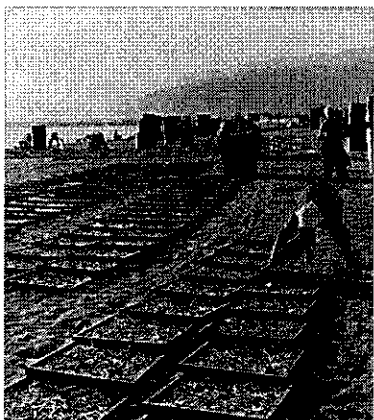
写真③ (写真集 15 頁)