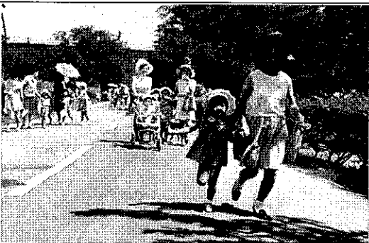
写真⑤ (写真展：夙川公園、写真集 60 頁)