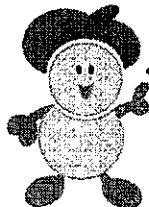
西宮市食育・健康づくりマスコット みやちゃん

他にも、「見る・聴く・食べる・体験する」ことを通じて、楽しみながら食について学ぶことができるブースがたくさん！！ぜひ、ご来場ください。