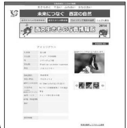
(西宮生きもの写真情報館イメージ画面)