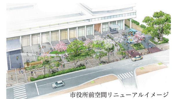
市役所前空間リニューアルイメージ