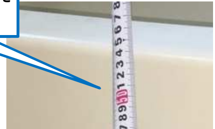
浴槽またぎ 高さ540mm (拡大)