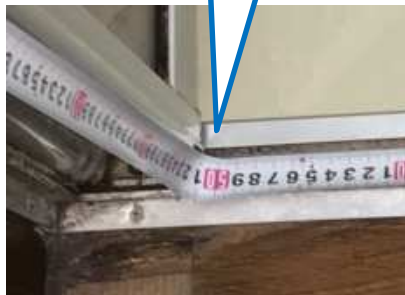
出入口有効 開口500mm (拡大)