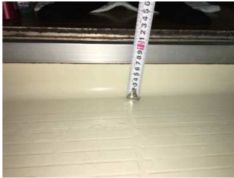
浴室側 出入口 段差±0mm