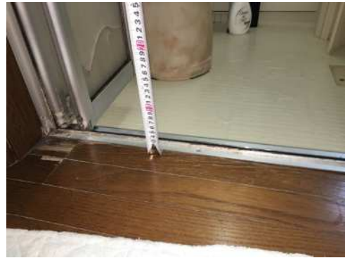
脱衣所側 出入口 段差±0mm